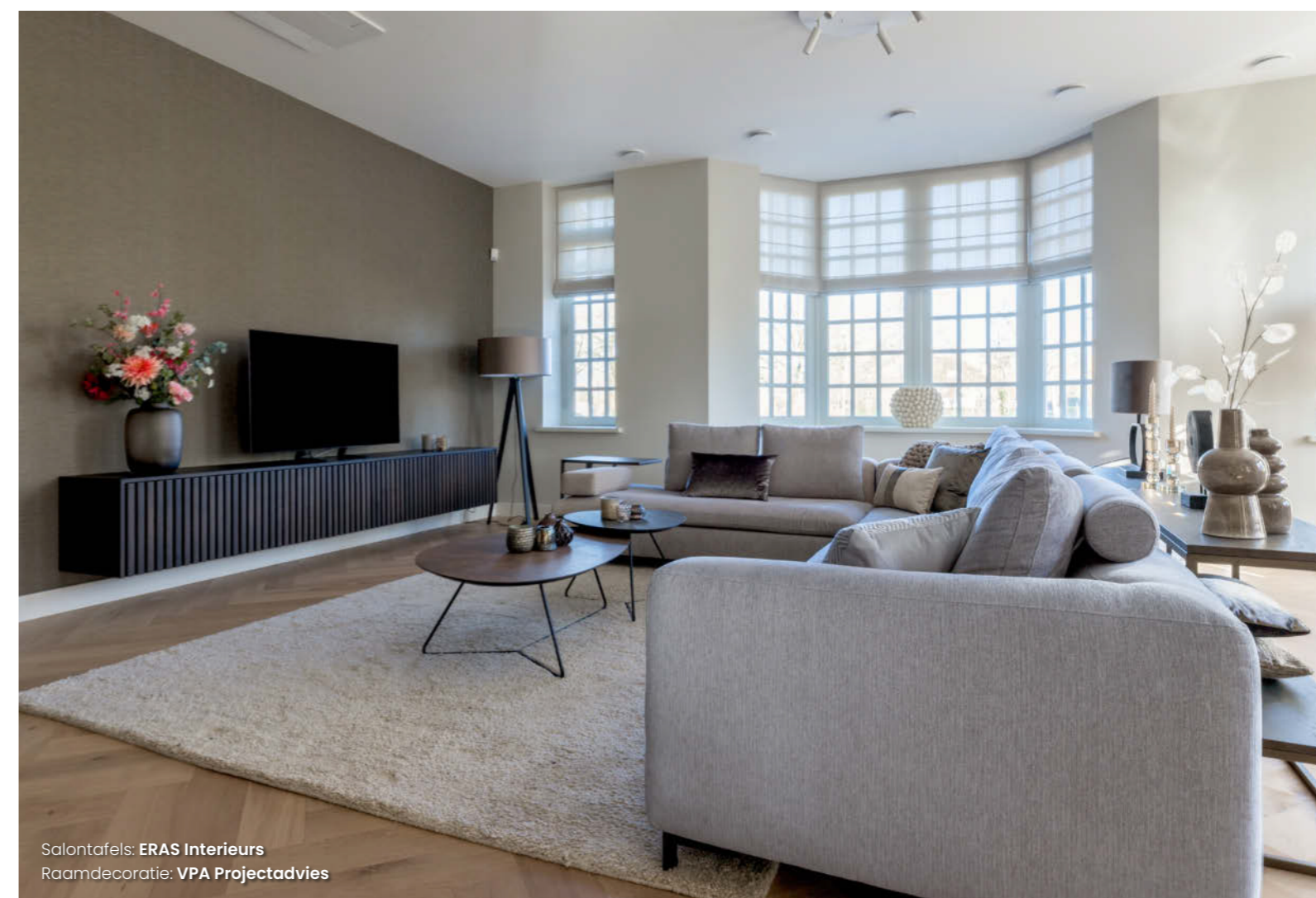
Salontafels: ERAS Interieurs Raamdecoratie: VPA Projectadvies