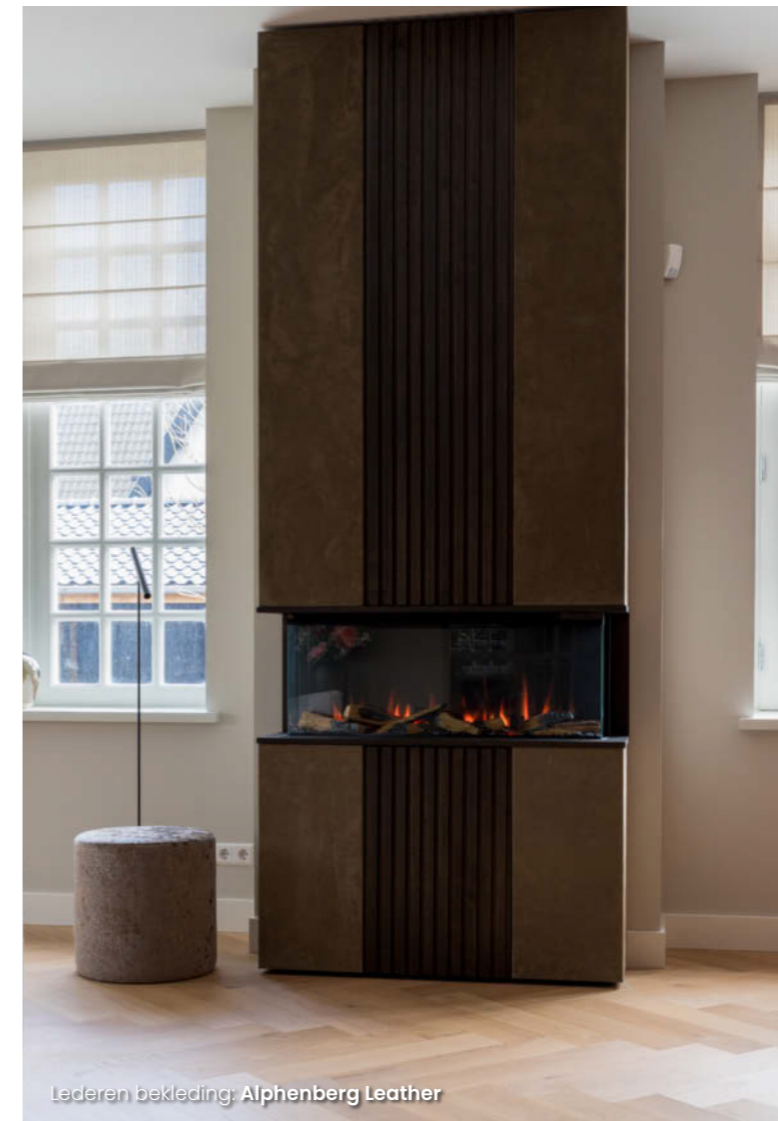
Lederen bekleding: Alphenberg Leather

de lusten van een tuin maar niet de lasten. Als ik uit het raam kijk, kijk ik overal in onze prachtige grote tuin en over het mooie ven dat bij ons voor de deur ligt. De overstap was daardoor niet zo groot."