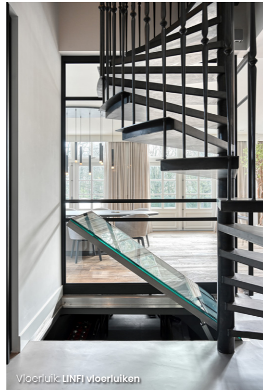
Vloerluis: LINF vloerluisen