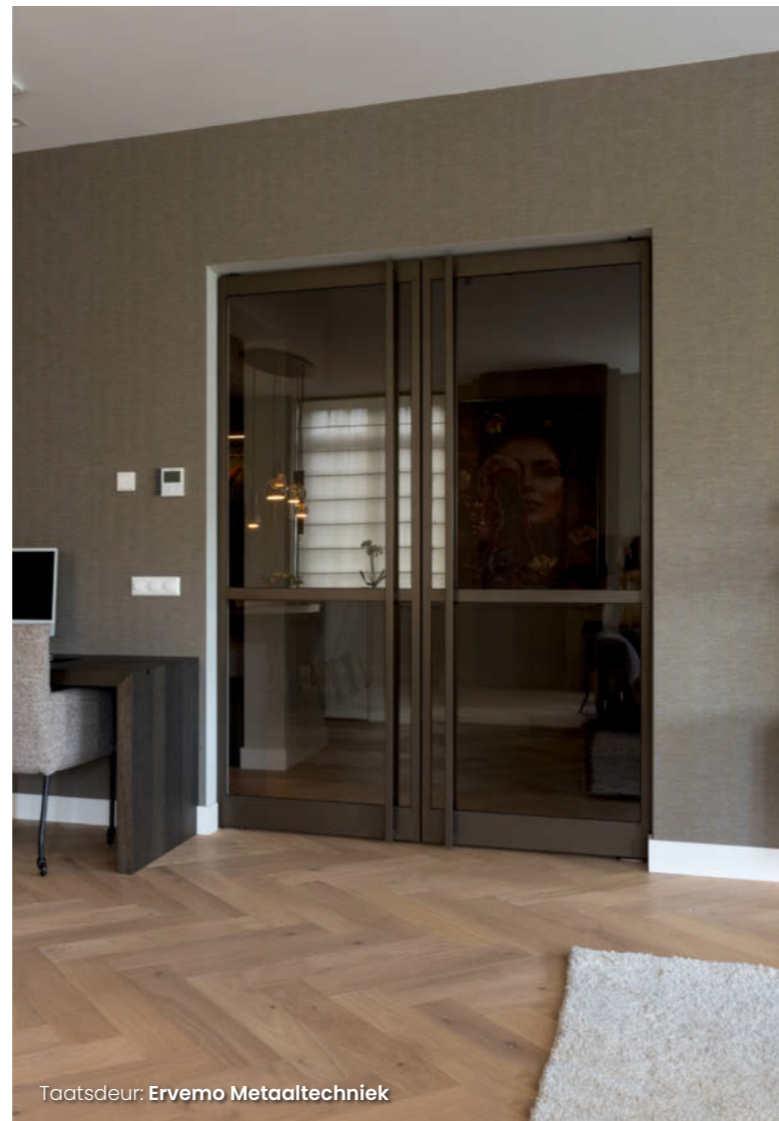
Taatsdeur: Ervemo Metaaltechniek

En dat is precies wat de wens van de bewoners was. "Ik werk thuis en wilde een eigen werkplek, maar geen afgesloten kantoor", zegt de vrouw des huizes. "Dat is goed gelukt met mijn eigen bureau, dat door Rebecca tussen de keuken en de woonkamer is gesitueerd. De kast moest een modern element zijn met veel vakken, maar ik moest er ook zoiets functioneels als een printer in kwijt kunnen. Mijn man en ik zijn begin zestig en geen tuinliefhebbers. De stap van een vrijstaand huis naar een appartement was dus een logische, maar we vreesden het opgeslotene van kleine kamers op een zoveelste verdieping. Toen dit hotel verbouwd werd tot veertien appartementen zagen we onze kans schoon door er een op het gelijkvloers te kopen. Hier hebben we twee ruime terrassen en zeeën van woonruimte, dus wel