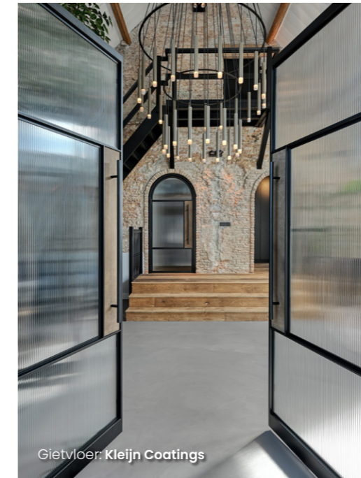
Gietvloer: Kleijn Coatings

Via de stalen wenteltrap komen we op de eerste verdieping van de boerderij. Ook hier is meer dan genoeg ruimte voor de bewoners en hun gasten. De hoge nok van het dak op de eerste verdieping doet de ruimte nog groter lijken. Aan het einde van de gang, voordat je de masterbedroom in stapt, passeer je de luxe badkamer. Elk detail is met zorg gekozen en de kleurcombinaties stralen een serene rust uit. Baden in het vrijstaande bad geeft je een gevoel van pure luxe. Mooi aan dit bad zijn de matte uitstraling en de strak vormgegeven staande kraan. Net als het bad, zijn de wasbakken gemaakt van het naadloze materiaal solid surface. De unieke vormgeving ervan is, samen met de minimalistische watervalkranen, een prachtig staaltje van vernuftig design. De Italiaanse wandtegels met subtiel reliëf stralen met hun natuurlijke tinten een tijdloze elegantie uit. In de douche is een infraroodpaneel gemonteerd, wat van het douchen een heerlijk spa-momentje maakt. Een discreet mozaïekpatroon in de douche voegt een vleugje speelsheid toe.