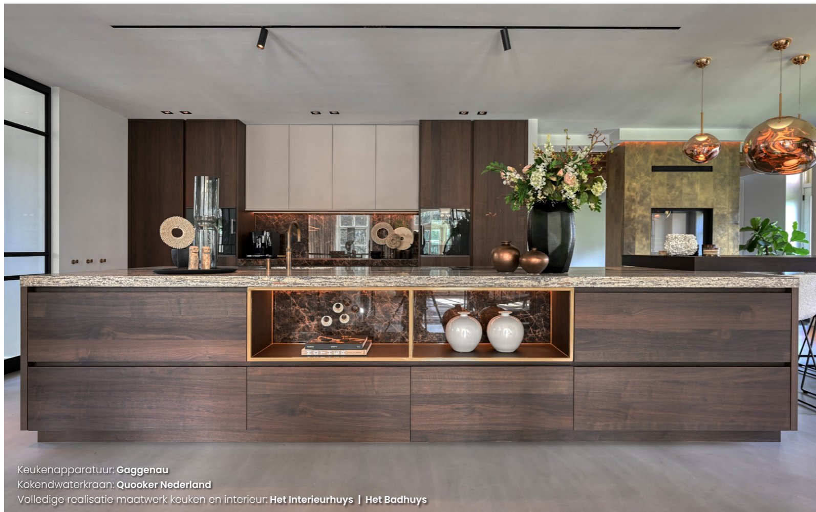
Keukenapparatuur: Gaggenau Kokendwaterkraan: Quooker Nederland Volledige realisatie maatwerk keuken en interieur: Het Interieurhuys | Het Badhuys

De renovatie van de boerderij begon met een nieuwe indeling van de plattegrond. Rebecca stelde voor om de benedenverdieping te openen en de ruimtes met elkaar te verbinden. De benedenverdieping is getransformeerd tot een open ruimte, waar toch subtiel zones zijn gecreëerd met behulp van glas en variatie in vloeren. Ook het plafond verspringt in hoogte, met een speels en verbindend effect als resultaat. Rebecca heeft er goed op gelet dat de meubels het vertrek vullen zonder massief te ogen. Daarom koos ze bijvoorbeeld voor een ovale eettafel, ronde zitmeubels en lichte lichtarmaturen. Door te werken met contrasten in materiaal en kleur deelt ze de grote ruimte visueel in een eetgedeelte en een zitgedeelte. Rebecca: "Ik let in mijn ontwerpen altijd op een harmonieuze verbinding tussen de elementen zodat elke hoek van de kamer visueel een samenhangend geheel wordt. Zo maakt het vloerkleed verbinding met de riante hoekbank, het losstaand lounge-element en de natuurstenen salontafel en vormt daarmee een intieme eenheid."