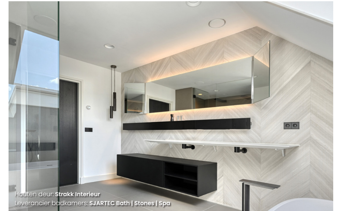
Houten deur: Strakk Interieur Leverancier badkamers: SJARTEC Bath | Stones | Spa