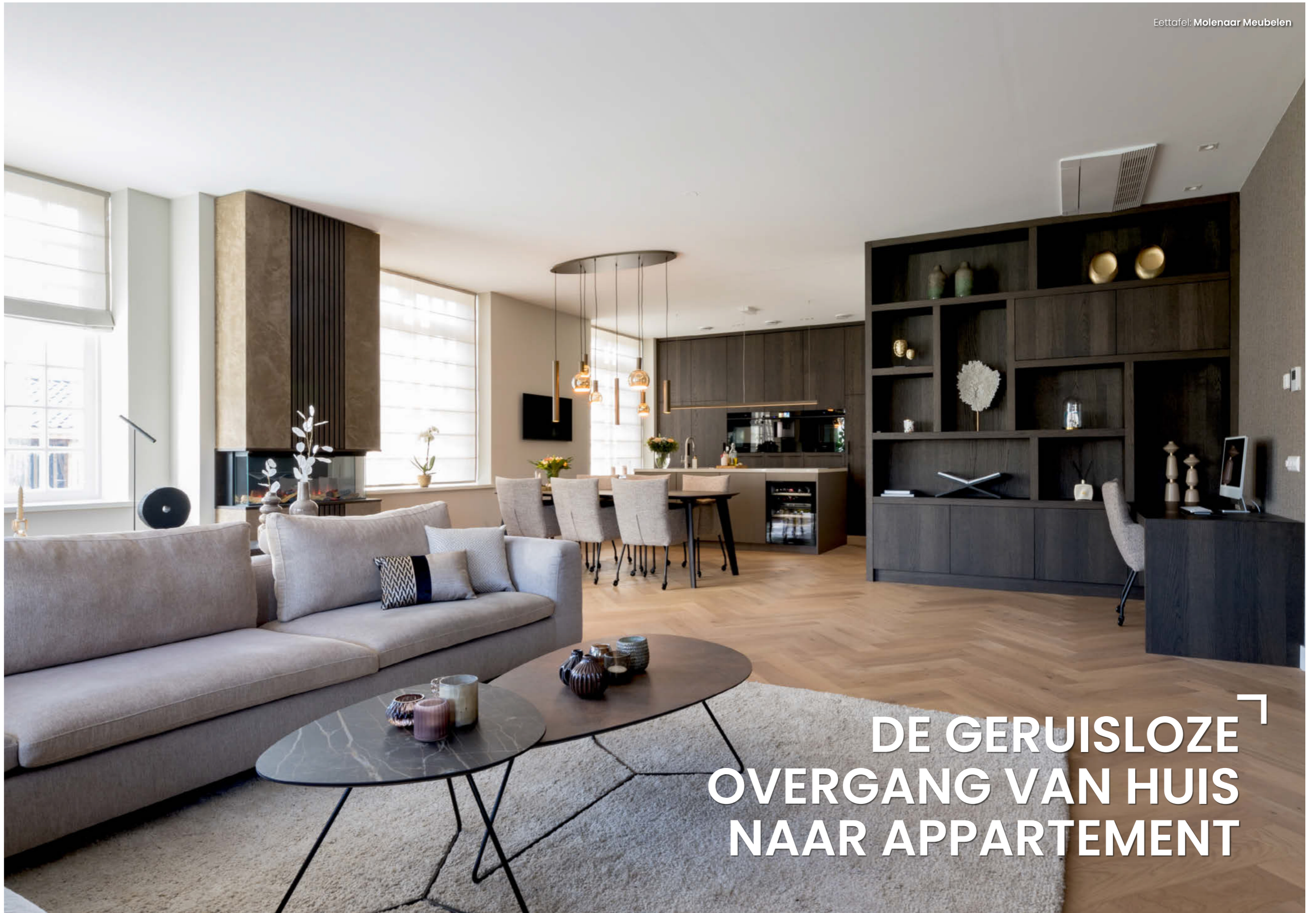
Eettafel: Molenaar Meubelen