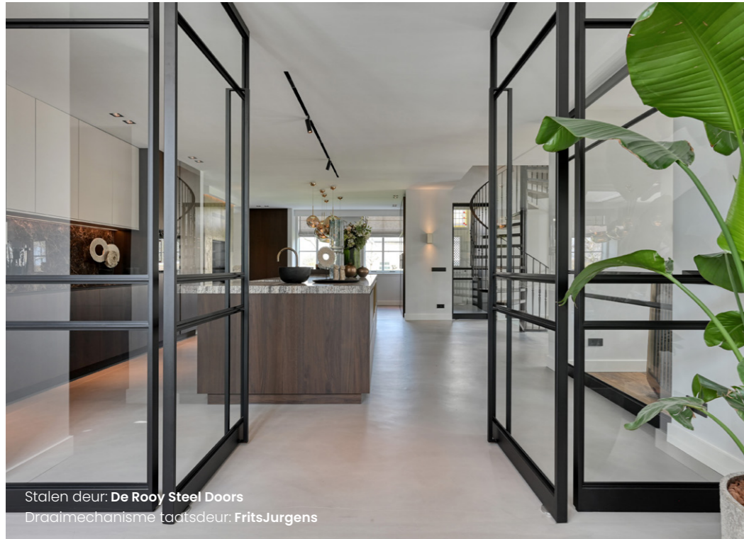
Stalen deur: De Rooy Steel Doors Draadmechanisme taatsdeur: FritsJurgens